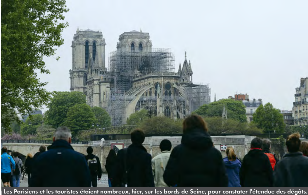
Les Parisiens et les touristes étaient nombreux, hier, sur les bords de Seine, pour constater l'étendue des dégâts.