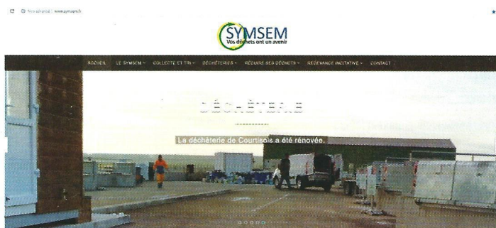
Découvrez l'actualité du SYMSEM